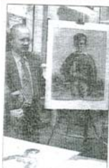
Imagen muy reciente del artista junto a su cartel de El Rastroillo 98.