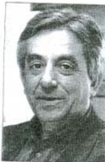
Antonio Rodríguez Almodovar.