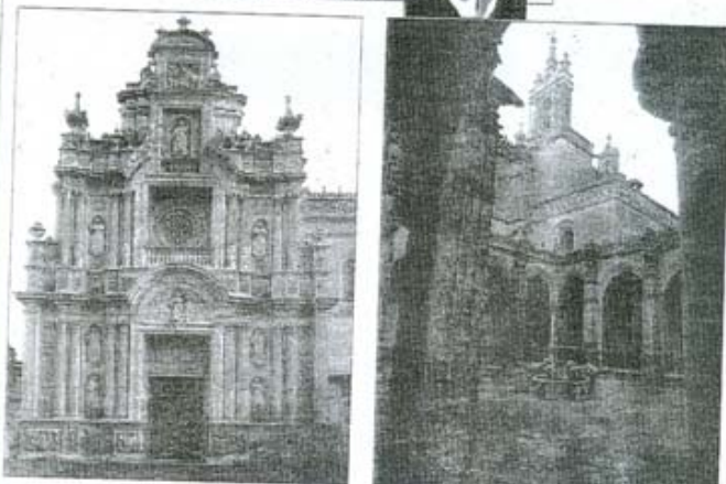
A la izquierda, imatronte de la iglesia (siglo XVII); a la derecha, vista de las espadañas desde un ángulo del Claustro.